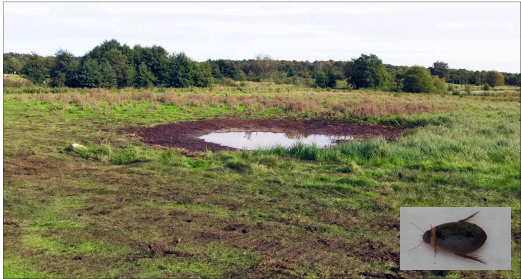
Et af de to nye vandhuller i Vaserne. Indsat: Lys skivvandkalv

I projektet er et firma med speciale i naturpleje i gang med at arbejde ved ni søer og tørvegrave. Konkret bliver der ryddet og tyndet ud i træopvækst, der graves af ved søbredder for at skabe levesteder med lavt vand på 30-50 cm. Enkelte steder oprensnes sumpvegetation og mudder.