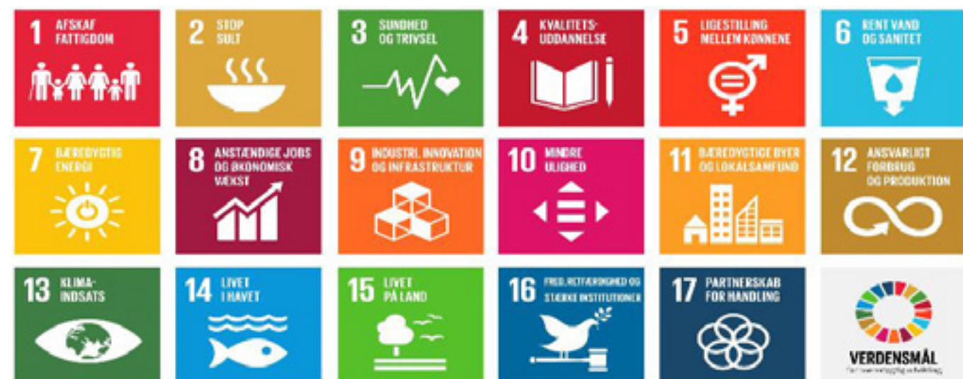
FN's 17 verdensmål for bæredygtig udvikling