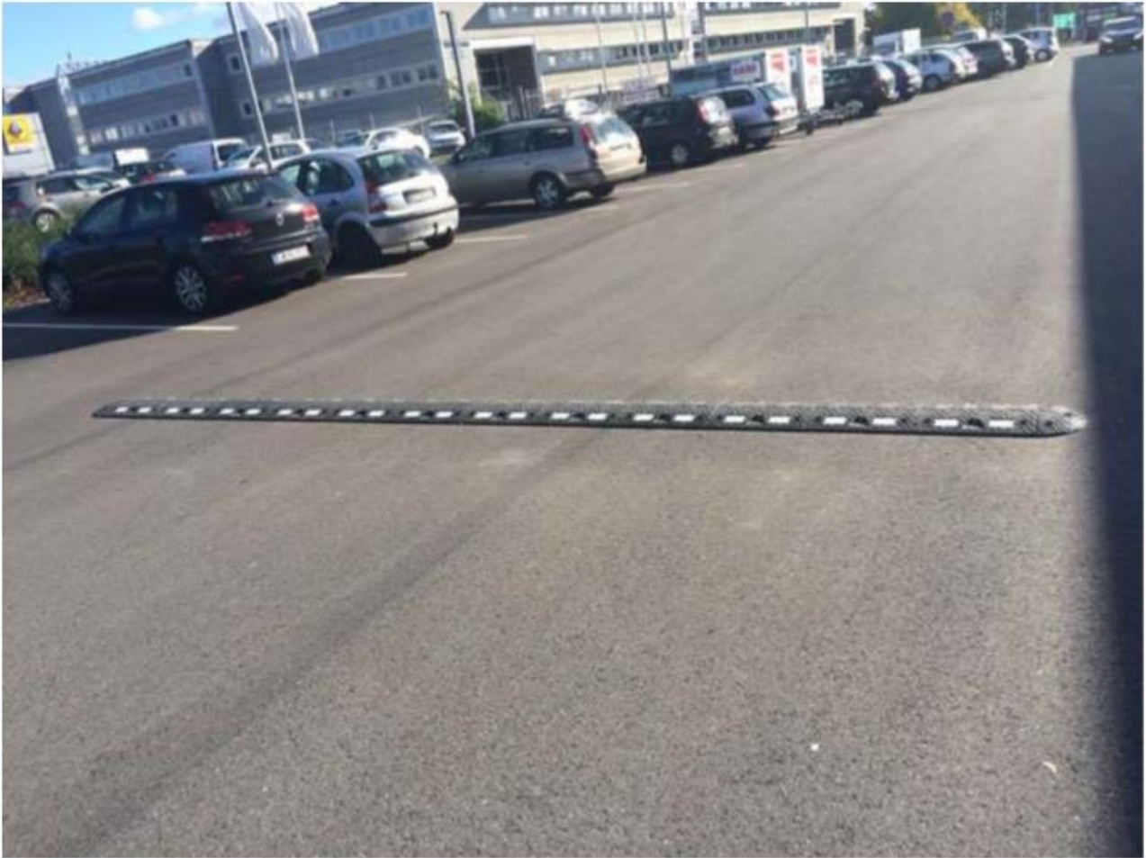
20 km/t vejbump ved indkørsel til forretning