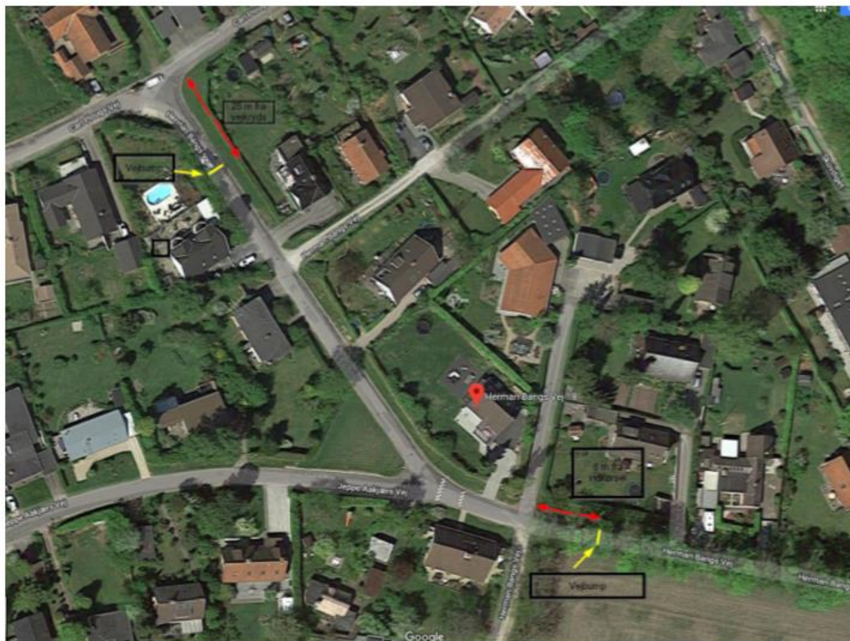
Vejbump Herman Bangs Vej.png